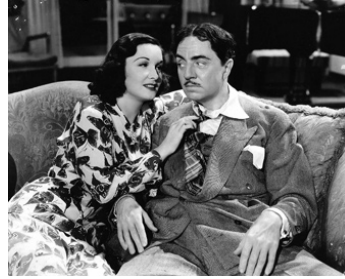
1941 FOLIE DOUCE (Love Crazy) de Jack Conway avec William Powell