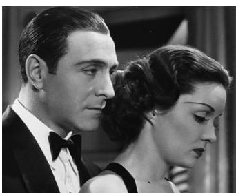
1937 HER HUSBAND LIES d'Edward Ludwig avec Ramon Novarro