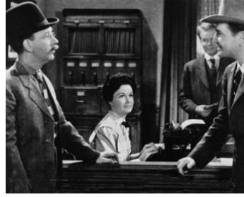
1939 RENO (Reno) de John Farrow avec Richard Dix