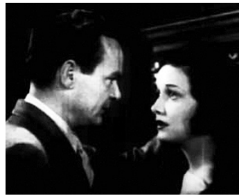
1934 TAKE THE STAND de Phil Rosen avec Russell Hopton