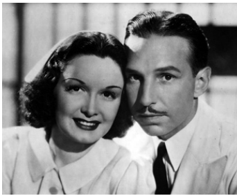
1938 L'ÉVADÉ D'ALCATRAZ (King of Alcatraz) de Robert Florey avec Lloyd Nolan