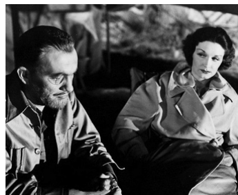
1936 CHASSEUR BLANC (White Hunter) d'Irving Cumming avec Wilfrid Lawson