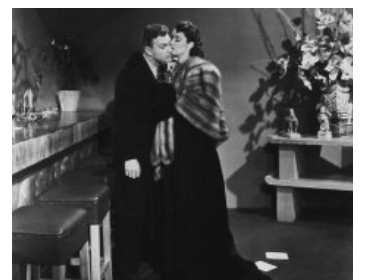
1946 RENDEZ-VOUS AVEC ANNIE (Rendez-Vous with Annie) d'A. Dwan avec Eddie Bracken