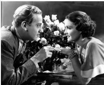
1936 THE LONE WOLF RETURNS de Roy William Neill avec Melvyn Douglas