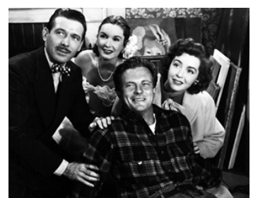
1948 THE INSIDE STORY d'Allan Dwan avec Robert Shayne, W. Lundigan, Marsha Hunt