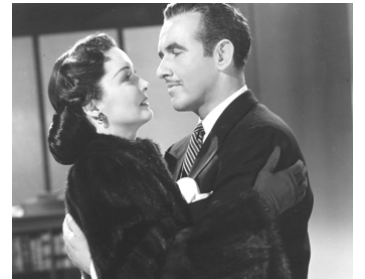
1945 TWICE BLESSED d'Harry Beaumont avec Preston Foster