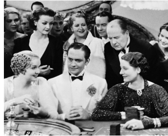
1935 LA FEMME DE SA VIE (No more Ladies) de George Cukor avec Fredric March