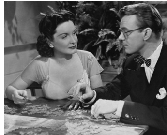
1944 UP IN MABEL'S ROOM d'Allan Dwan avec Dennis O'Keefe