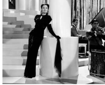
1942 SIX DESTINS (Tales of Manhattan) de Julien Duvivier