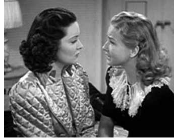
1940 GALLANT SONS de George B. Seitz avec Bonita Granville