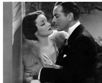
1937 DEUX FEMMES (John Meade's Woman) de Richard Wallace avec Sidney Blackmer