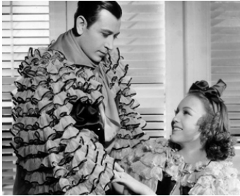
1935 LA DERNIÈRE RUMBA (Rumba) de Marion Gering avec George Raft