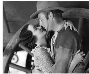
1934 WAGON WHEELS de Charles Barton avec Randolph Scott