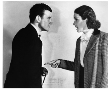
1939 DISBARRED de Robert Florey avec Robert Preston