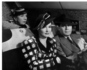
1937 ARTISTES ET MODÈLES (Artists and Models) de R. Walsh avec Hedda Hooper, Jack Benny