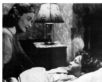
1947 KING OF THE WILD HORSES de George Archainbaud avec Bill Sheffield