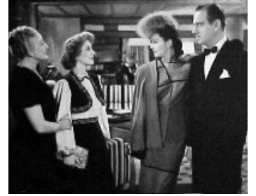
1942 DANSE AUTOUR DE LA VIE (We were dancing) de R. Z. Leonard avec M. Douglas, N. Shearer