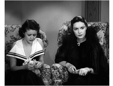
1935 THOMAS L'INCREDULE (Doubting Thomas) de David Butler avec Billie Burke