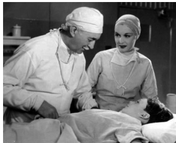
1935 SYMPHONIE BURLESQUE (The Big Broadcast of 1936) de N. Taugo avec Guy Standing