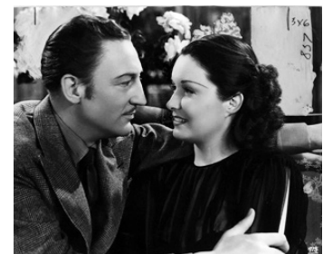
1938 FEMMES DÉLAISSEES (Wives under Suspicion) de J. Whale avec Warren Williams