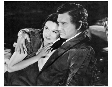
1939 MAN OF CONQUEST de George Nichols Jr avec Richard Dix