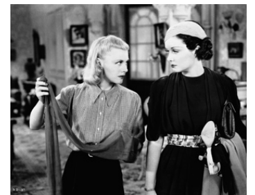
1937 PENSION D'ARTISTES (Stage Door) de Dorothy Arzner avec Ginger Rogers