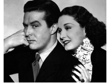
1940 LE DOCTEUR SE MARIE (The Doctor takes a Wife) de Garson Kanin avec Ray Milland