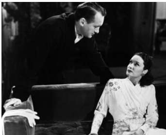
1942 QUIET PLEASE, MURDER de John Larkin avec George Sanders