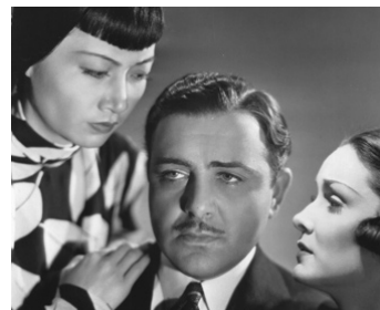
1938 DANGEROUS TO KNOW de Robert Florey avec Anna May Wong, Akim Tamiroff