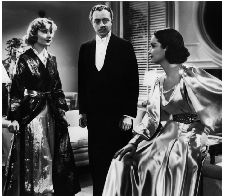
1936 MON HOMME GODFREY (My Man Godfrey) de Gregory La Cava avec Carole Lombard, William Powell