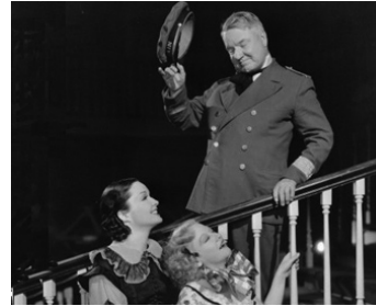
1935 MISSISSIPPI (Mississippi) de Wesley Ruggles avec Joan Bennett, W. C. Fields