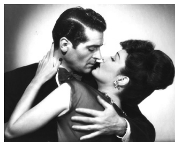
1946 LE SECRET DE LA MADONNE (The Madonna's Secret) de Wilhelm Thiele avec Francis Lederer