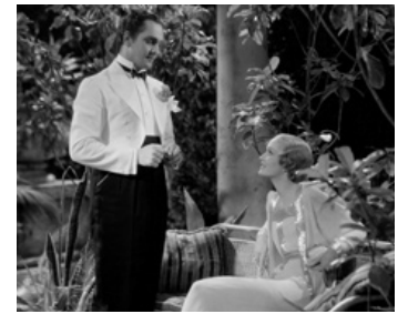
1934 LA MORT PREND DES VACANCES (Death takes a Holiday) de M. Leisen avec F. March