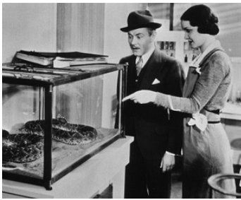
1933 MEURTRES AU ZOO (Murders in the Zoo) d'A. Edward Sutherland avec Charles Ruggles