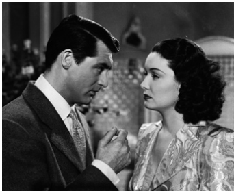
1940 MON ÉPOUSE FAVORITE (My favorite Wife) de Garson Kanin avec Cary Grant