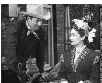
1946 PLAINSMAN AND THE LADY de Joseph Kane avec Bill Elliott