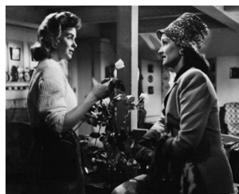
1946 CLAUDIA ET DAVID (Claudia and David) de Walter Lang avec Dorothy McGuire