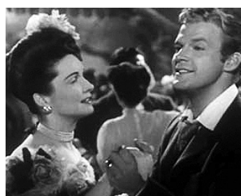
1947 LA FILLE DU CALENDRIER (Calendar Girl) d'Allan Dwan avec William Marshall