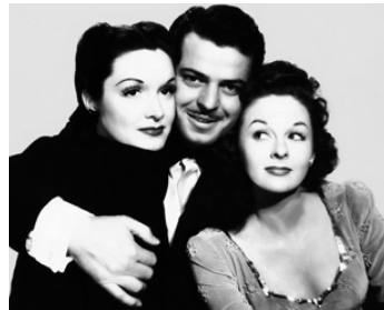
1943 HIT PARADE OF 1943 d'Albert S. Rogell avec John Carroll, Susan Hayward