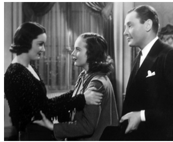
1938 DÉLICIEUSE (Mad about Music) de Norman Taurog avec Herbert Marshall