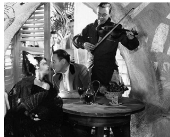
1936 THE PREVIEW MURDER MYSTERY de Robert Florey avec Rod LaRocque