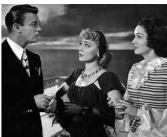
1945 BREWSTER'S MILLIONS d'Allan Dwan avec Dennis O'Keefe, Helen Walker